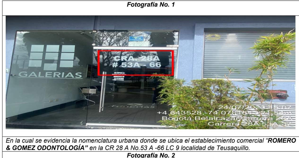
Fotografía No. 1